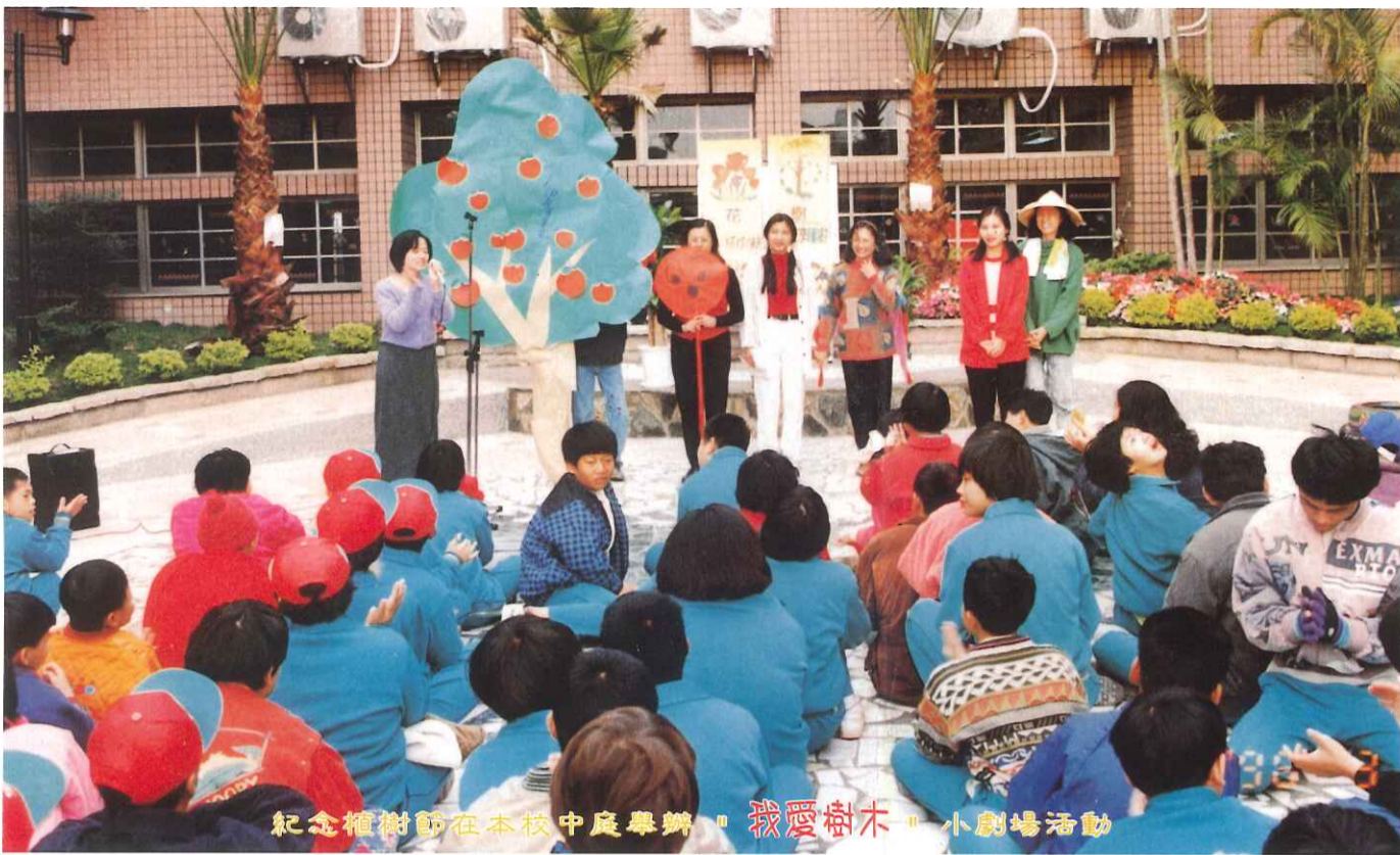
紀念植樹節在本校中庭舉辦。我愛樹木。小劇場活動