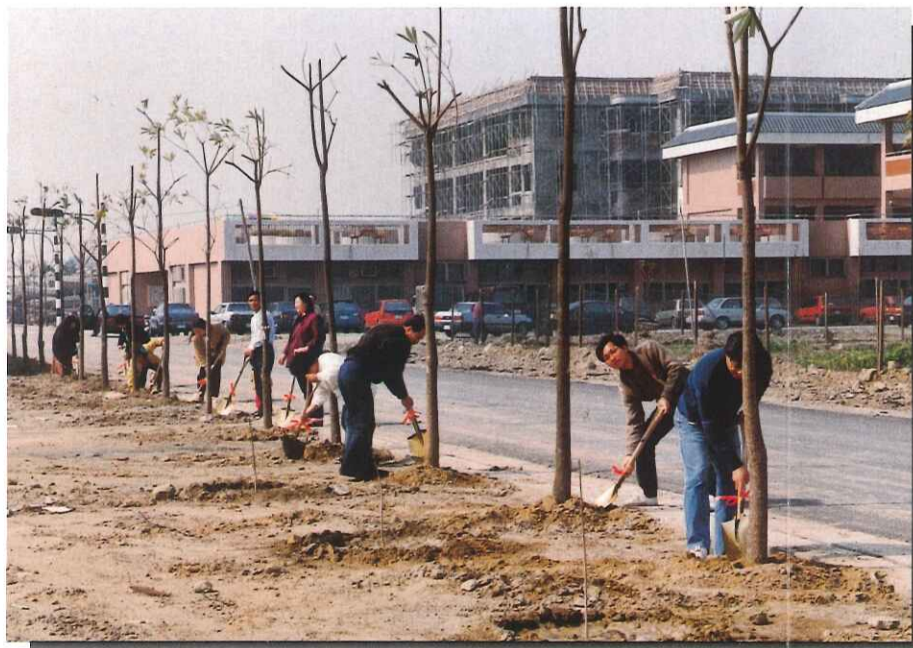
植樹節校長與家長代表進行植樹活動